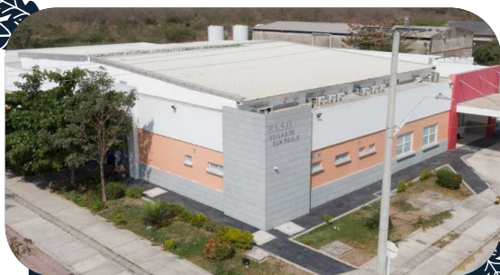
PASO VILLAS DE SAN PABLO