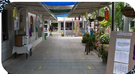
CENTRO DE DESARROLLO INFANTIL (CDI)