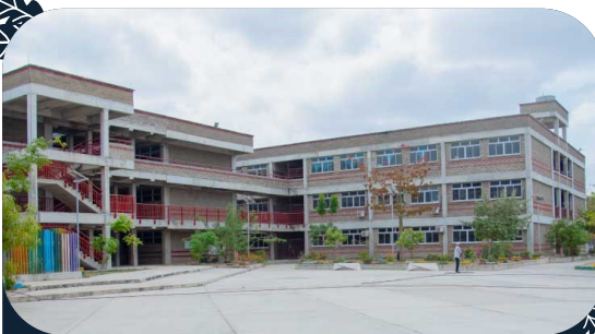
INSTITUCIÓN EDUCATIVA DISTRITAL VILLAS DE SAN PABLO