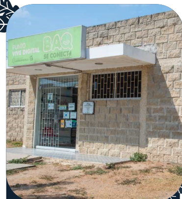
PUNTO VIVE DIGITAL