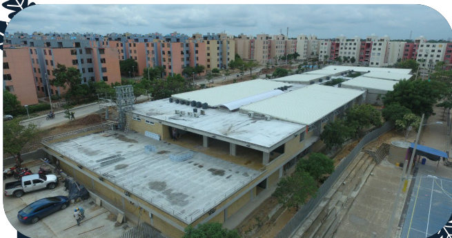
SEDE DEL SENA EN LAS CAYENAS