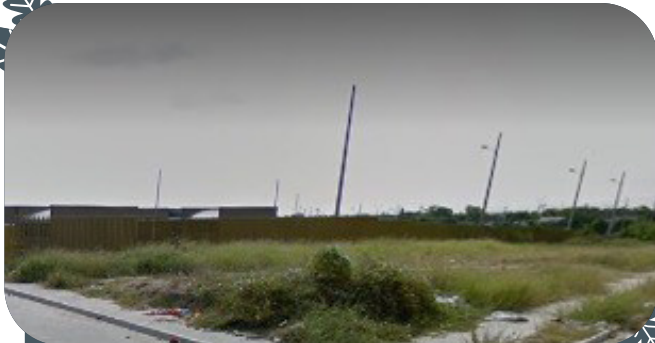
Terreno baldío en el que actualmente se ubica la sede del sena en las cayenas