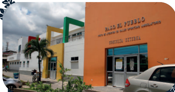
PASO El Pueblo