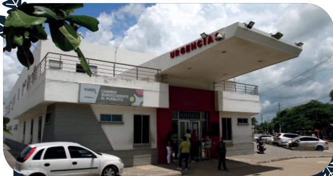
CAMINO Suroccidente El Pueblito