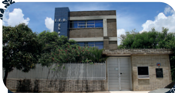
I.E.D El Pueblo